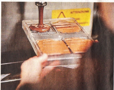
Um den Produzenten ein faires Gehalt zu zahlen, müsste die Tafel drei Euro kosten.