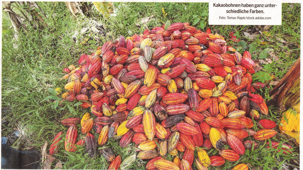
Kakaobohnen haben ganz unterschiedliche Farben.