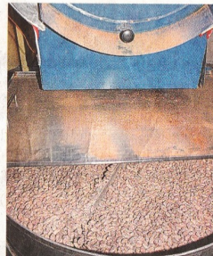
Etwa 50 Kakaobohnen werden für eine 100-Gramm-Tafel benötigt.